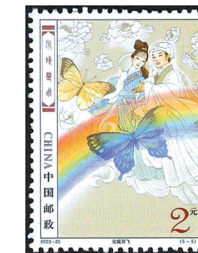
2003-20《民间传说——梁山伯与祝英台》5-5 化蝶双飞

文化兴国运兴,文化强民族强。驻马店邮政通过“国家名片”的形式,把驻马店的史、今天与未来连接,将天中精神与“中国梦”的时代主题融入方寸之间,彰显了驻马店深厚的历史文化底蕴。下一步,驻马店邮政将深入学习贯彻党的二十大精神,积极发扬“传邮万里,国脉所系”的历史传承,在服务社会民生的基础上,依托邮票这一独特的文化载体,把美丽驻马店、文化驻马店和本地农产品资源“寄出去”。同时,立足农业大市实际,发挥邮政商流、物流、资金流、信息流“四流合一”优势,助力打通农产品进城“最初一公里”和工业品下乡“最后一公里”,为服务乡村振兴战略,推动“六个现代化驻马店”建设作出新的更大贡献。