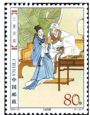
2003-20《民间传说——梁山伯与祝英台》5-2 三载同窗