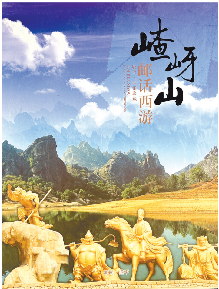
《嵯峨山邮话西游》邮册

驻马店位于河南省中南部,素有“豫州之腹地、天下之最中”之美誉,是华夏文明重要的发祥地之一,孕育出了盘古文化、螺祖文化、梁祝文化、重阳文化,哺育出了韩非、李斯等一批历史名人,独领风骚的历史沉淀构成了驻马店人厚积薄发的文化基因。