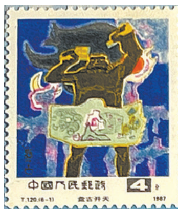
T120《中国古代神话》6-1 盘古开天

为大力弘扬传承中国优秀的历史文化资源,中国邮政于1987年9月25日发行《中国古代神话》特种邮票,其中“盘古开天”生动地表现了盘古开天辟地的形象;于2003年10月4日(农历九月初九)发行《重阳节》特种邮票,描绘了人们在重阳节登高、赏菊和饮酒对弈的情景;于2003年10月8日发行《民间传说——梁山伯与祝英台》特种邮票,描绘了梁山伯与祝英台草桥结拜、三载同窗、十八相送、楼台伤别、化蝶双飞的情景;于2019年8月6日发行《中国古代神话(二)》特种邮票,其中就有《螺祖始蚕》的邮票。一张张邮票如同一条条小船,一头载着历史文化,一头载着五湖四海,把驻马店悠久的历史文化传播到全国各地,传承着中华民族的文化记忆。