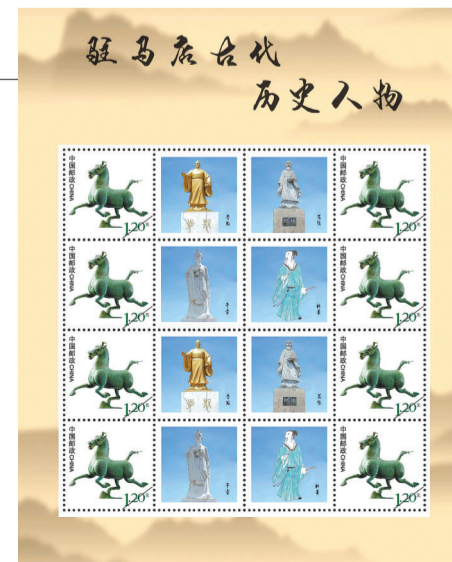
《驻马店历史人物》个性化邮票