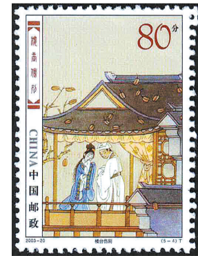
2003-20《民间传说——梁山伯与祝英台》5-4 楼台伤别