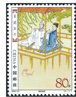
2003-20《民间传说——梁山伯与祝英台》5-1 草桥结拜