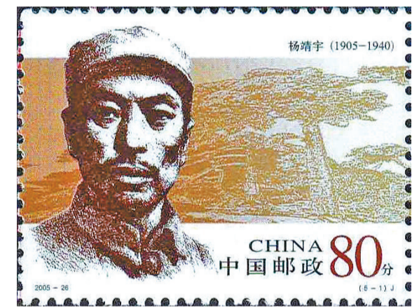
2005-26《人民军队早期将领(二)》5-1 杨靖宇

2022年,驻马店邮政申请发行了《驻马店历史人物》个性化邮票,展现了秦相李斯、无神论者范缜、志怪小说鼻祖干宝、重阳人物桓景等著名历史人物。通过发行系列人物邮票,激励着天中儿女奋发进取、开拓创新、舍生取义、忠贞爱国,传承发扬了以“诚信、开放、创新、自强”为核心的驻马店精神内涵。