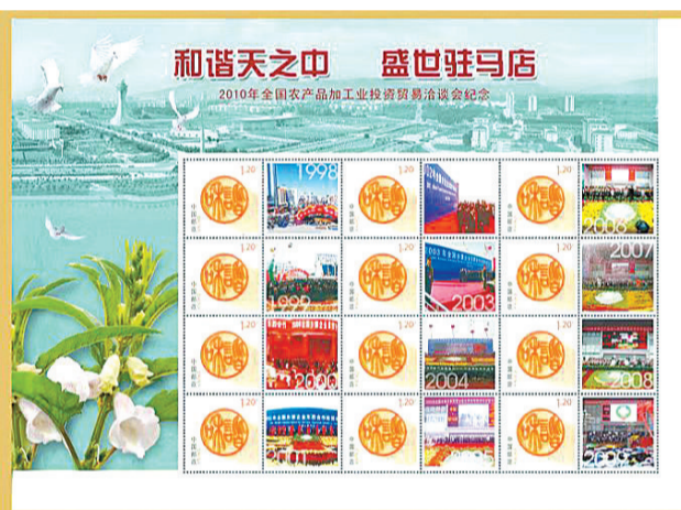
《和谐天之中 盛世驻马店》——2010年全国农产品加工业投资贸易洽谈会纪念个性化邮票

“农为邦本,本固邦宁”。驻马店作为农业大市,近年来大力发展优质小麦、优质花生、优质白芝麻和蔬菜、食用菌、林果等高效作物,逐渐形成了资源利用高效、生态系统稳定、产地环境良好、产品质量安全的农业发展新格局,实现了“农业大市”向“农业强市”转变。自1998年开始,中国农产品加工业投资贸易洽谈会——全国唯一以农产品加工为主题的5A级投资贸易洽谈会已连续在驻马店举办了25届。为服务好驻马店经济社会发展,驻马店邮政申请发行了《和谐天之中 盛世驻马店》个性化邮票,展现驻马店以投洽会为载体和平台打造“国际农都”战略定位的发展历程。此外,还倾力打造《方寸映天中》邮册,将邮票、历史文化、人文景观完美结合,全方位展现了深邃的天中文化,进一步丰富了农洽会的文化内涵,提高了驻马店的知名度和美誉度。