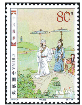
2003-20《民间传说——梁山伯与祝英台》5-3 十八相送