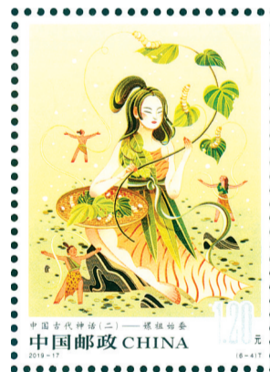
2019-17《中国古代神话(二)》6-4 螺祖始蚕