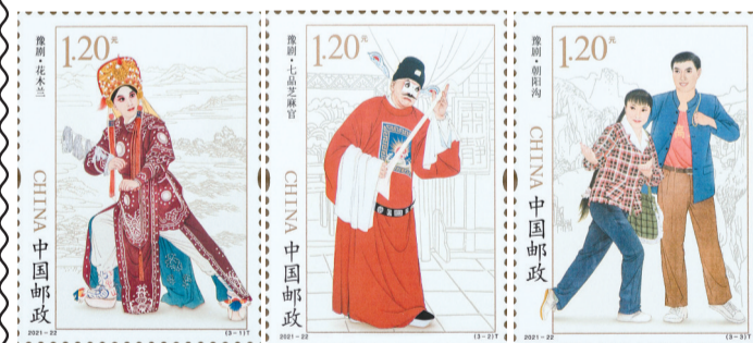
2021-22《豫剧》3-1 花木兰 3-2 七品芝麻官 3-3 朝阳沟