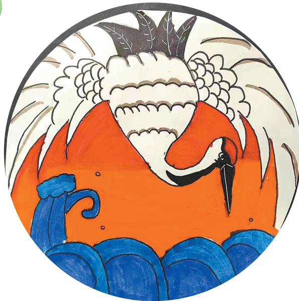
驻马店市第十小学二(5)班 张又昕 (指导老师：翟二霞)