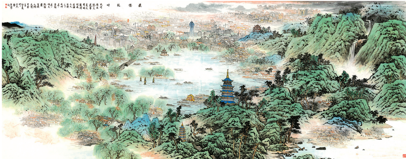
《最忆杭州》 杨留义/绘