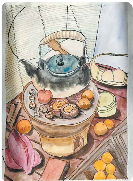
驻马店市第二十七小学 五(6)班 张昊然 (小记者证号:2327625) (指导老师:张盼盼)