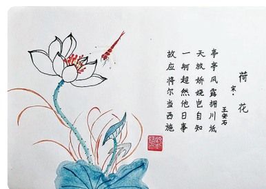
驻马店市第二十七小学 三(1)班 顾紫钰 (小记者证号:2327140) (指导老师:王琳)