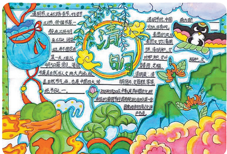
驻马店市第二十七小学 五(8)班 李任霖 (小记者证号:2327596) (指导老师:张楠楠)