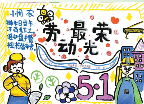
驻马店市第二十七小学 五(10)班 孙雨菲 (指导老师:吴珂)