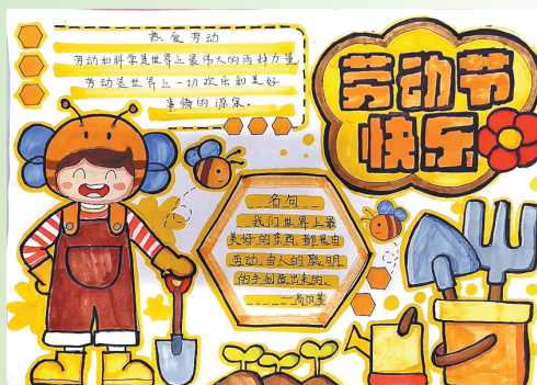
驻马店市第二十七小学五(10)班 张胧月 (指导老师:吴珂)