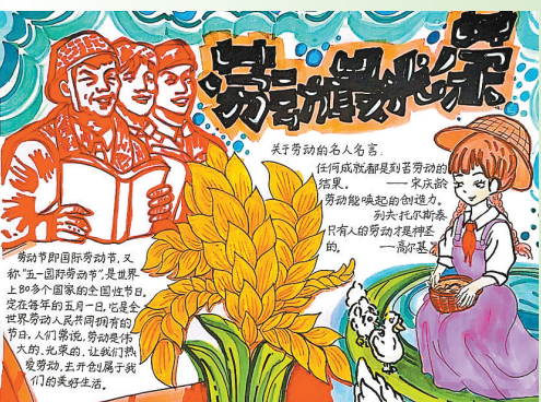
驻马店市第二十七小学 五(8)班 孙婧熙 (指导老师:张楠楠)