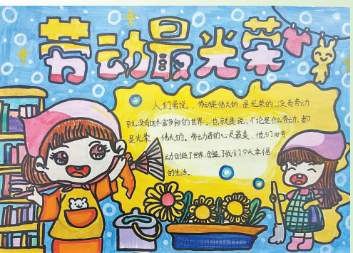
驻马店市第二十七小学 四(15)班 宋雨点 (指导老师:曹杨茹)