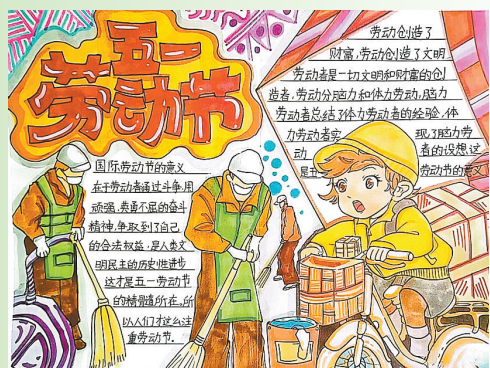
驻马店市第二十七小学五(8)班 刘榕邦 (指导老师:张楠楠)