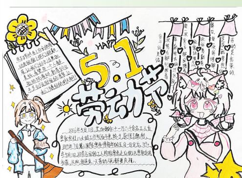
驻马店市第二十七小学 五(10)班 唐雯婕 (指导老师:张盼盼)