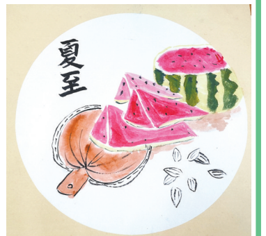
驻马店市第二十四小学 三(4)班 刘铭洋 (小记者证号:24240198) (指导老师:温明贤)