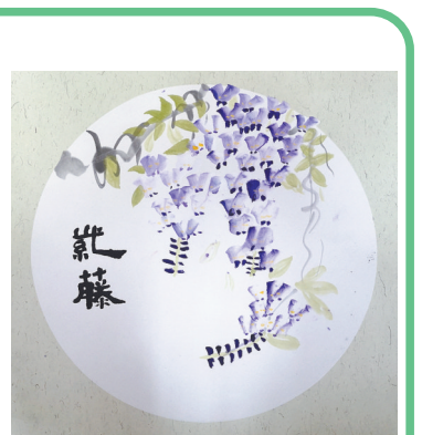
驻马店市第二十四小学 三(4)班 魏于涵 (小记者证号:24240199) (指导老师:温明贤)