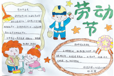
驻马店市第二十七小学 三(1)班 郑泽楷