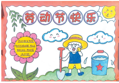
驻马店实验小学慎阳路校区 三(2)班 陈煜铭 (小记者证号:2301438) (指导老师:秦玉娇)