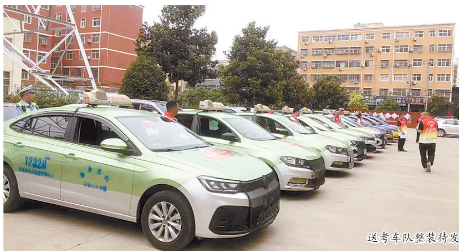
送考车队整装待发

本报讯(文/图 全媒体记者 曾富强 见习记者 周游)6月5日上午,西平县2024年“棠河杯”爱心助考公益活动启动。