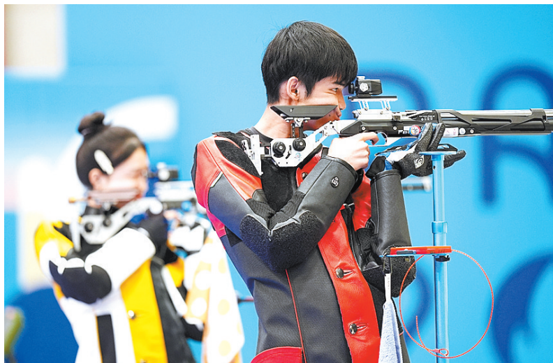
7月27日,中国选手黄雨婷/盛李豪(右)在比赛中。