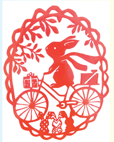
驻马店市第二十五小学 三(3)班 潘子昂 (小记者证号:24250106) (指导老师:杨旭)

夏天是丰收的，我们可以悠闲地坐在竹椅上吃着黑子红瓤的西瓜看美丽的风景。还可以吃到冰凉的冰激凌，这是我最喜欢甜点之一。 夏天也是炎热的，夏天的太阳就像一个火轮挂在天空中。就连天上的云朵也汗流浹背，时不时地来场阵雨，给大地洗个凉水澡。 夏天是快乐的，夏天爸爸妈妈可以带着我去山里避暑，感受大自然带给我们的凉爽。夏天还有很长很长的暑假，暑假是一年中 longest 的假期了。 夏天是美丽的，因为我可以穿上五颜六色的裙子，欢快地玩耍。 夏天是我最喜欢的季节，一切都那么美好和欢快。 (小记者证号:24250106) (指导老师:杨旭)