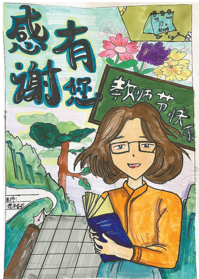
驻马店实验小学文渊路校区 四(2)班 苗恩赫 (小记者证号:24004043) (指导老师:张春艳)