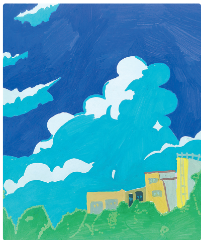
驻马店实验小学文渊路校区 四(4)班 刘一诺 (小记者证号:24004057) (指导老师:潘宝玉)