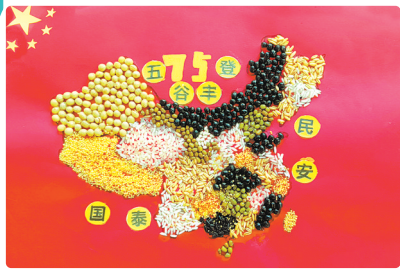
驻马店市第二十四小学 四(7)班 徐铭哲 (小记者证号:24240234) (指导老师:任姗姗)