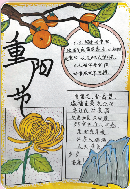
驻马店市第九小学三(2)班 刘子睿 (指导老师：杨昕)