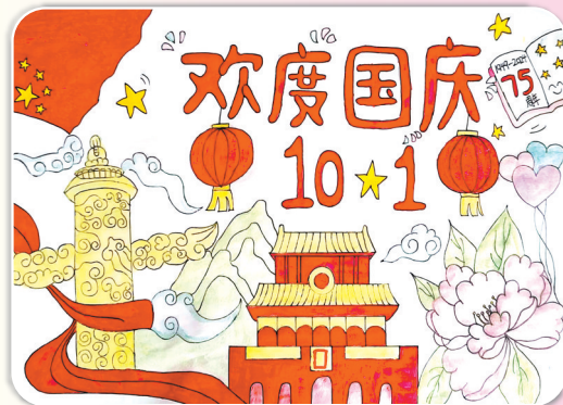
驻马店市第九小学四(2)班 郭美希 (指导老师：周雪振)