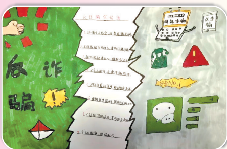
驻马店市第九小学三(1)班 杨俊逸 (指导老师：李莹)