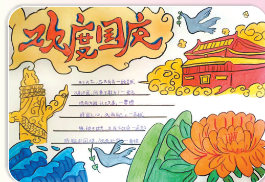
驻马店市第九小学四(9)班 崔博稳 (指导老师：周雪振)