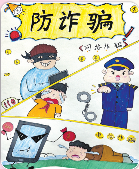
驻马店市第九小学三(1)班 朱梓硕 (指导老师：李莹)