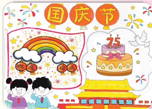
驻马店市第九小学五(7)班 陈羲 (指导老师：易林)