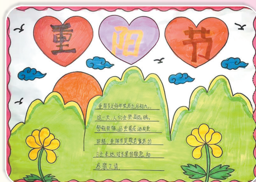
驻马店市第九小学三(2)班 王思琪 (指导老师：杨昕)