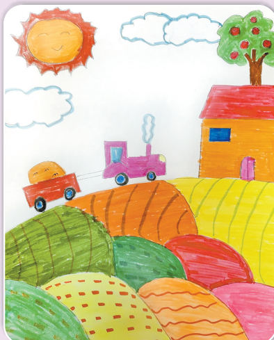
驻马店市第十二小学四(5)班 戚鸣震 (小记者证号:24120197) (指导老师:张美娥)