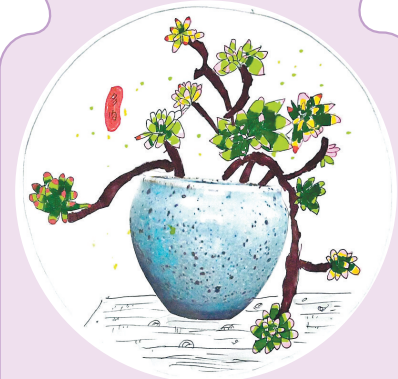
驻马店市第十二小学三(1)班 张润泽 (小记者证号:24120121) (指导老师:杨瑞)