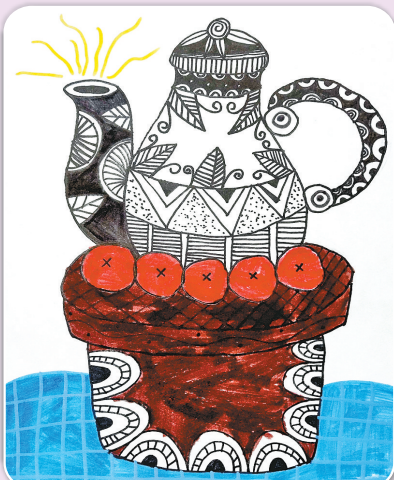
驻马店市第十二小学三(1)班 梁芮 (小记者证号:24120089) (指导老师:杨瑞)