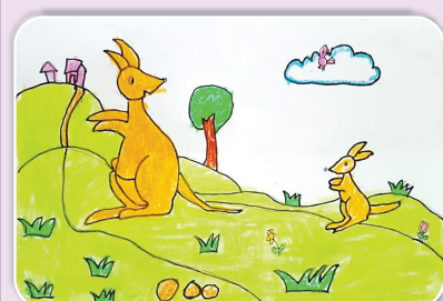
驻马店市第十二小学二(1)班 王一帆 (小记者证号:24120050) (指导老师:郭素贞)