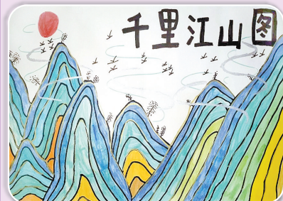
驻马店市第十二小学二(1)班 张子烨 (小记者证号:24120049) (指导老师:郭素贞)