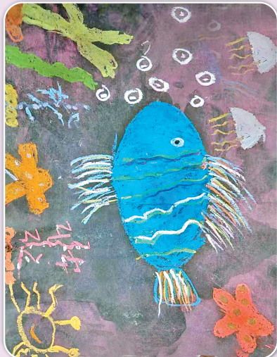
驻马店市第十二小学二(1)班 韩婉玥 (小记者证号:24120053) (指导老师:郭素贞)