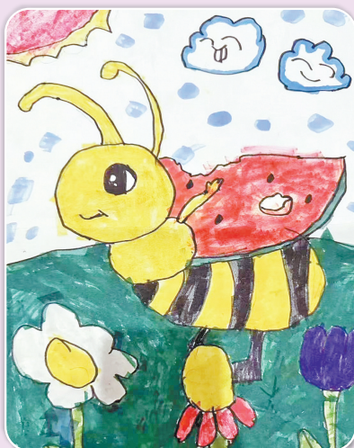
驻马店市第十二小学二(4)班 孔令洋 (小记者证号:24120021) (指导老师:余参参)