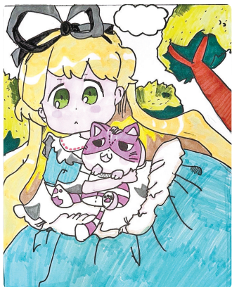
驻马店市第二十四小学五(6)班 焦诗雅 (小记者证号:24240270) (指导老师:李琦)