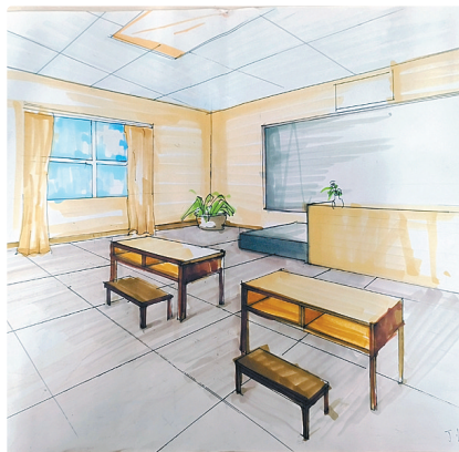
驻马店市第二十四小学二(7)班 丁怡冉 (小记者证号:24240076) (指导老师:赵亚会)