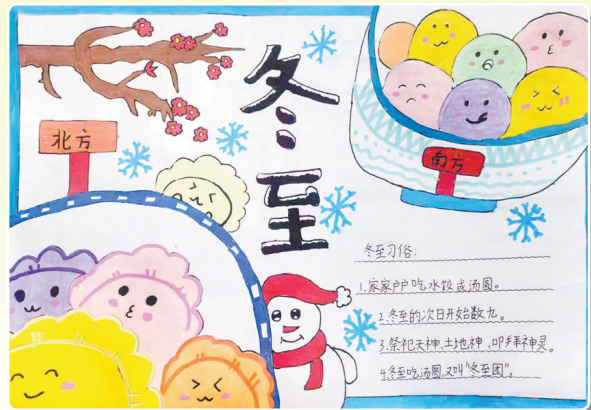
驻马店市第九小学三(6)班 杨雨蝶 (小记者证号:24090157) (指导老师:刘卫然)