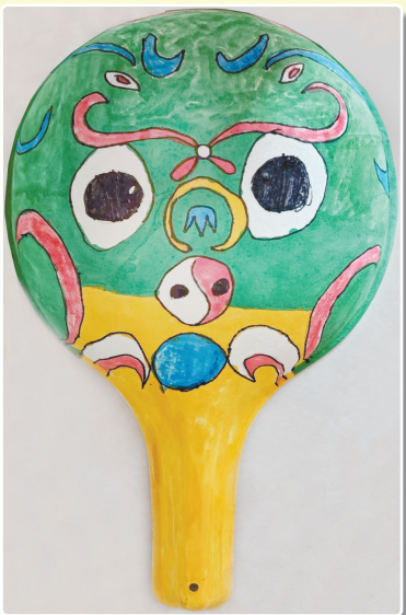
驻马店市第九小学二(5)班 杨禹恒 (小记者证号:24090042) (指导老师:张晨)