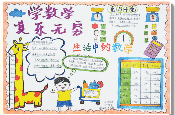
驻马店市第九小学三(8)班 崔博玺 (小记者证号:24090184) (指导老师:李应霞)