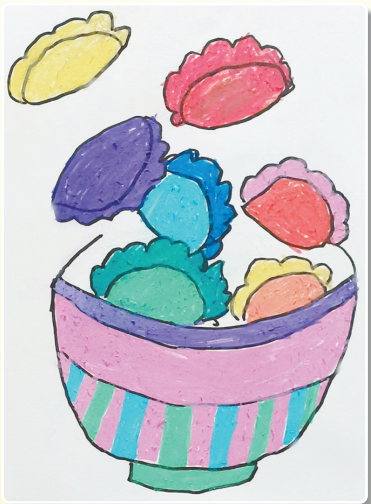
驻马店市第九小学二(2)班 高翀 (小记者证号:24090019) (指导老师:李森森)