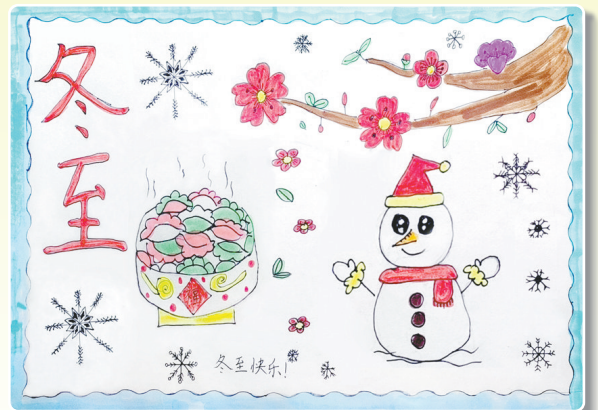
驻马店市第九小学五(7)班 陈羲 (小记者证号:24090334) (指导老师:易林)