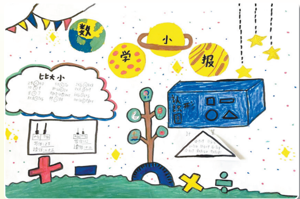
驻马店市第九小学二(6)班 李羽宸 (小记者证号:24090069) (指导老师:陈婷婷)