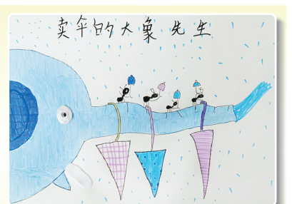
驻马店市第九小学二(5)班 伍博睿 (小记者证号:24090043) (指导老师:张晨)