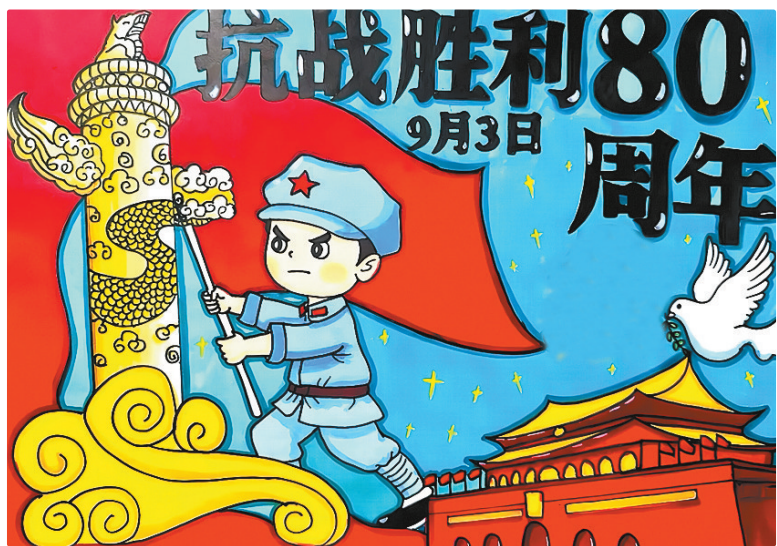
驻马店市第二十四小学五(3)班 吴玥潼 (小记者证号:25240082) (指导老师:程玉)