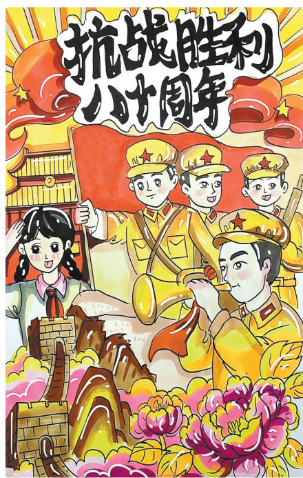
驻马店市第二十四小学五(7)班 王若萱 (小记者证号:25240053) (指导老师:任姗姗)