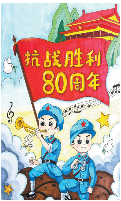
驻马店市第二十四小学六(2)班 刘钰川 (小记者证号:25240058) (指导老师:李清照)