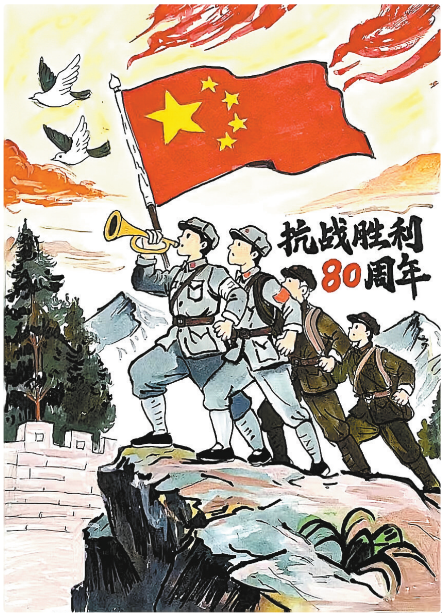
驻马店市第二十四小学五(1)班 付奕涵 (小记者证号:25240040) (指导老师:席远)