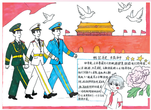
(小记者证号:25602212) (指导老师:张秀珍) 驻马店第二实验小学二(二)班 李晟旭