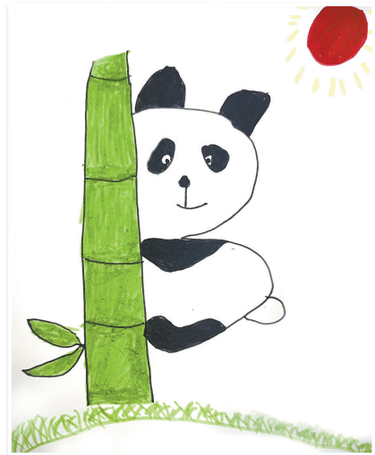
驻马店第二实验小学南校区 一(8)班 陈星硕 (小记者证号:25602263) (指导老师:贾萌萌)