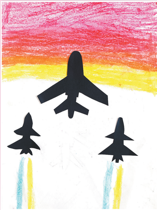
驻马店第二实验小学二(8)班 张之筱 (小记者证号:25602264) (指导老师:贾萌萌)