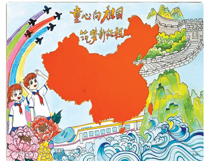
西平县柏城三里湾小学 二(1)班 焦九月 (指导老师:张瑞)