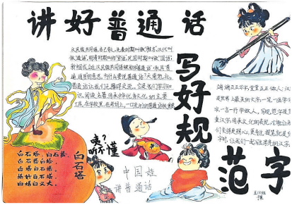
西平县柏城三里湾小学 五(3)班 于果 (指导老师:邵丽平)