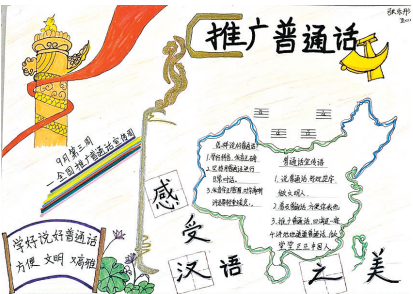
西平县柏城三里湾小学 五(1)班 张乐彤 (指导老师:李红霞)