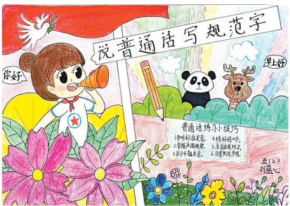
西平县柏城三里湾小学 五(2)班 刘蓝心 (指导老师:孙书琴)