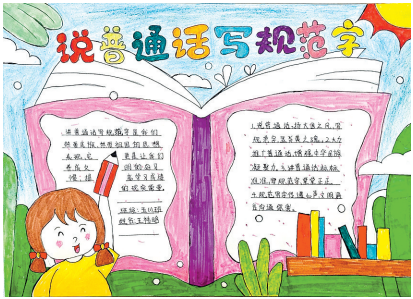
西平县柏城三里湾小学 五(1)班 王祎晗 (指导老师:李红霞)