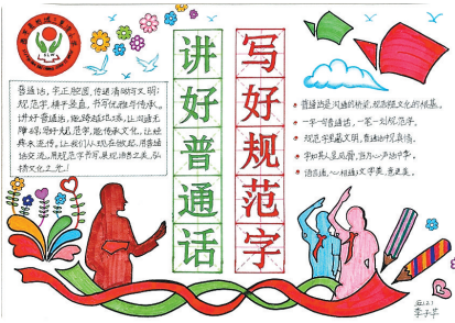
西平县柏城三里湾小学 五(2)班 李子芊 (指导老师:孙书琴)