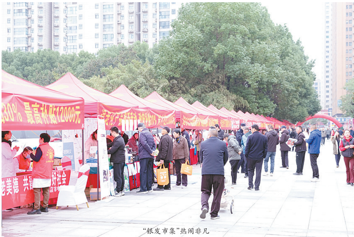
“银发市集”热闹非凡