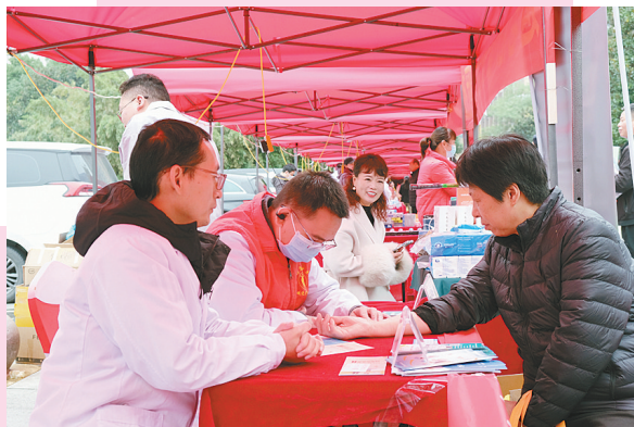
市中医院医生为市民把脉问诊