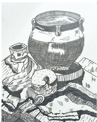
驻马店市第二十五小学 六(3)班 王梓懿 (指导老师:胡馨心)