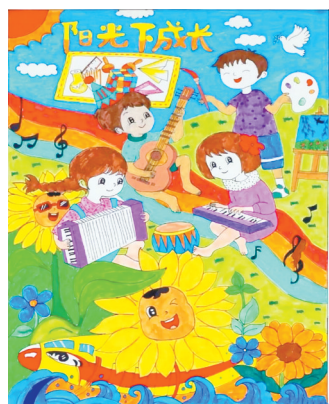
驻马店市第二十五小学 五(1)班 赵允曦 (小记者证号:25250128) (指导老师:张凯)