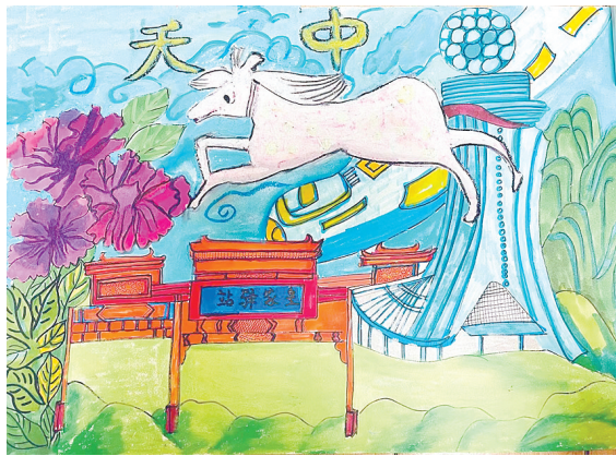
驻马店市第二十四小学三(5)班 邢晋睿 (小记者证号:25240013)(指导老师:赵利)