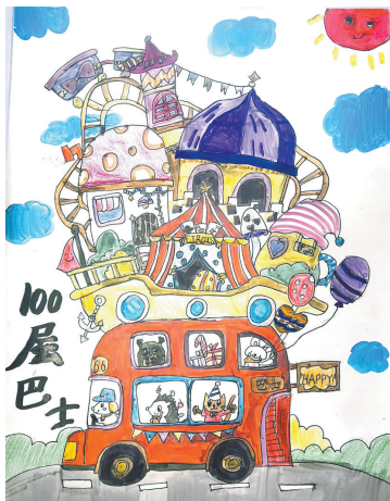
市第二十四小学三(4)班 徐艺馨 (小记者证号:25240008) (指导老师:翟雪如)