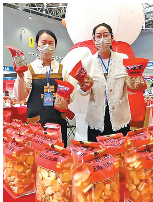
众多产品购物无忧