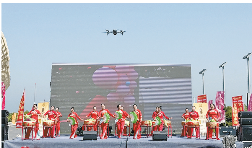
舞台节目精彩纷呈