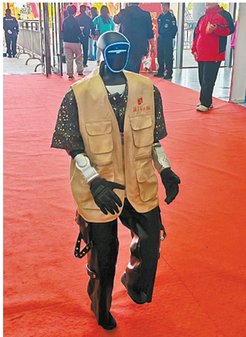
机器人亮相消博会