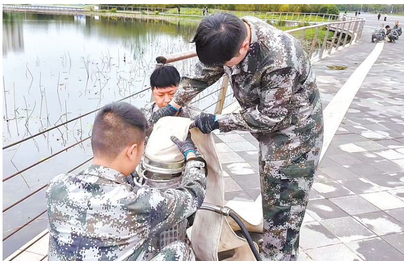
急处置效率,为汛期高效应对城市内涝、保障安全度汛积累了实战经验。